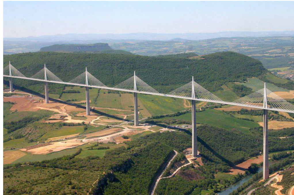
Viaduc de Millau, pont à haubans d'une longueur totale de 2460 m, avec des portées de 204 m et 342 m (2001-2004)