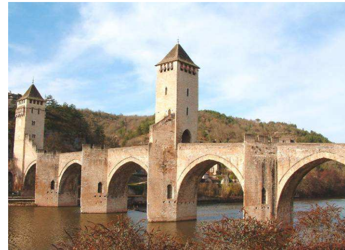
Cahors, pont Valentré achevé en 1378

La pierre a de bonnes caractéristiques mécaniques en compression, mais résiste peu à la traction. Les ouvrages sont donc constitués en arcs, en voûtes, permettant ainsi une bonne utilisation des performances de ce matériau (celui-ci étant alors en compression uniquement), mais ce procédé limite la distance (portée) entre appuis (piles), de l'ordre de 50 mètres.