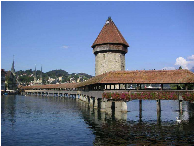
Le pont de la Chapelle à Lucerne, construit en 1365

Le bois a été le matériau le plus utilisé dans l'Antiquité et jusqu'au XVIIe siècle.