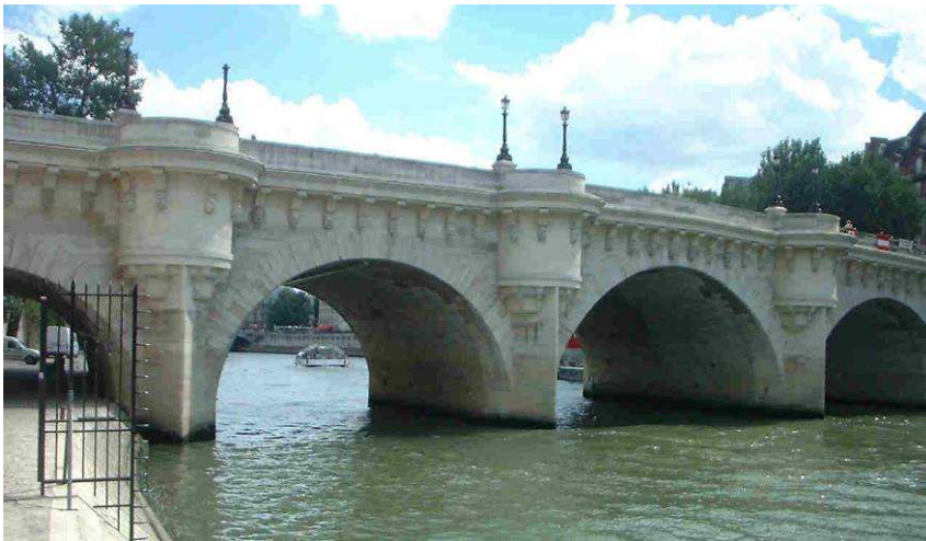
Paris, Pont Neuf achevé en 1606

Le bois était un matériau très courant, simple à travailler, mais ses caractéristiques mécaniques limitées, sensible aux incendies et aux intempéries. C'est pourquoi la pierre et la maçonnerie furent utilisées pour des ouvrages plus importants et durables, depuis la haute Antiquité jusqu'à la fin du XIXe siècle.