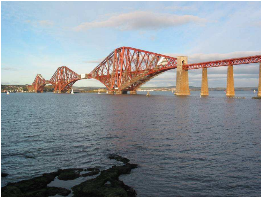
Pont du Firth of Forth (Écosse), réalisé en 1890, avec deux travées de 521 mètres.

L'acier, avec de très bonnes caractéristiques mécaniques et qui fut mis au point vers 1867, va permettre d'accroître les performances des ponts et amener des structures beaucoup plus légères.