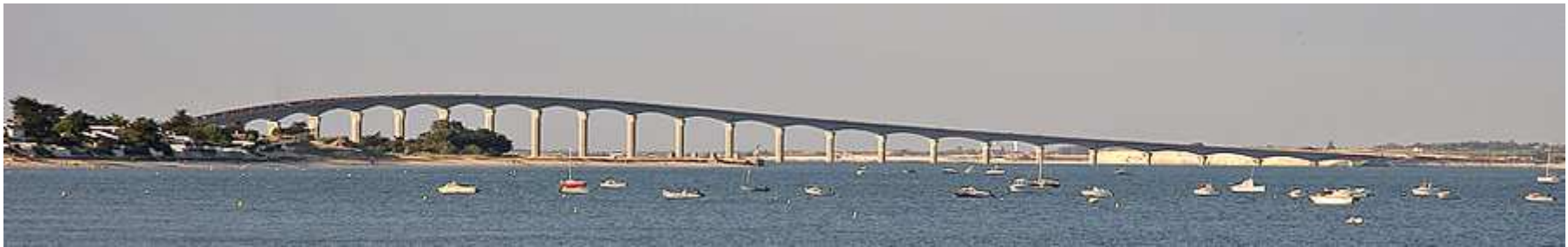
Pont de l'Île de Ré, inauguré en 1988. La longueur totale de l'ouvrage est de 2927 m, avec des portées de 110 m.

Grâce au béton précontraint, de nouvelles méthodes de construction ont été mises en oeuvre, permettant la réalisation de ponts en béton dans des zones géographiques difficiles, et avec des formes légères.