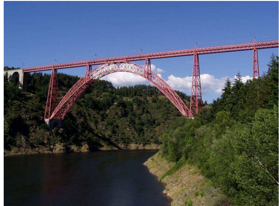
Pont viaduc de Garabit (Cantal), achevé en 1884, avec une portée de 165 mètres.

L'un des grands ingénieurs français de cette époque est Alexandre Gustave Eiffel (1832 -1923).