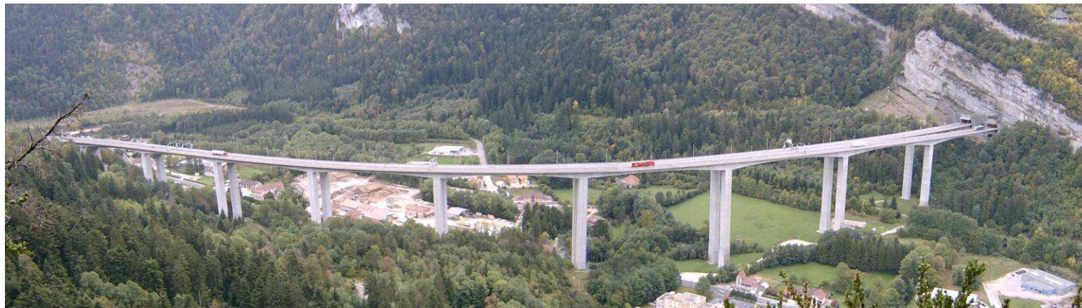
Viaduc de Nantua, ouvrage sur l'A40, inauguré en 1988.