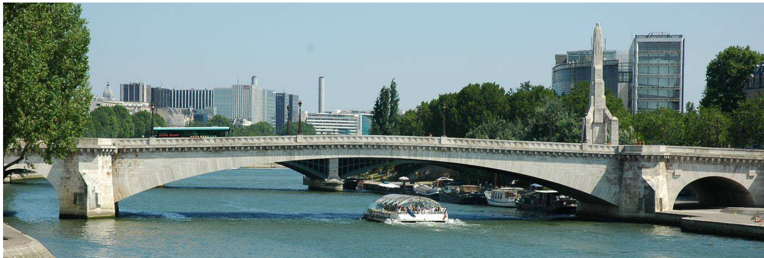
Pont de la Tournelle (Paris), pont en arc encastré d'une longueur totale de 120 m, début de la construction en 1928 et inauguré en 1930.

C'est au XIXème siècle, en 1845, que la formulation du béton est mise au point (mélange de granulats, de sable, de ciment et d'eau dans des proportions précises). Vint ensuite le béton armé (association d'armatures en acier au béton), puis le béton précontraint. Une nouvelle famille de ponts apparaît alors. Les caractéristiques mécaniques du béton armé font que l'on construit des ponts en arcs, mais avec des portées plus importantes que les ponts en maçonnerie, de l'ordre de 100 m.