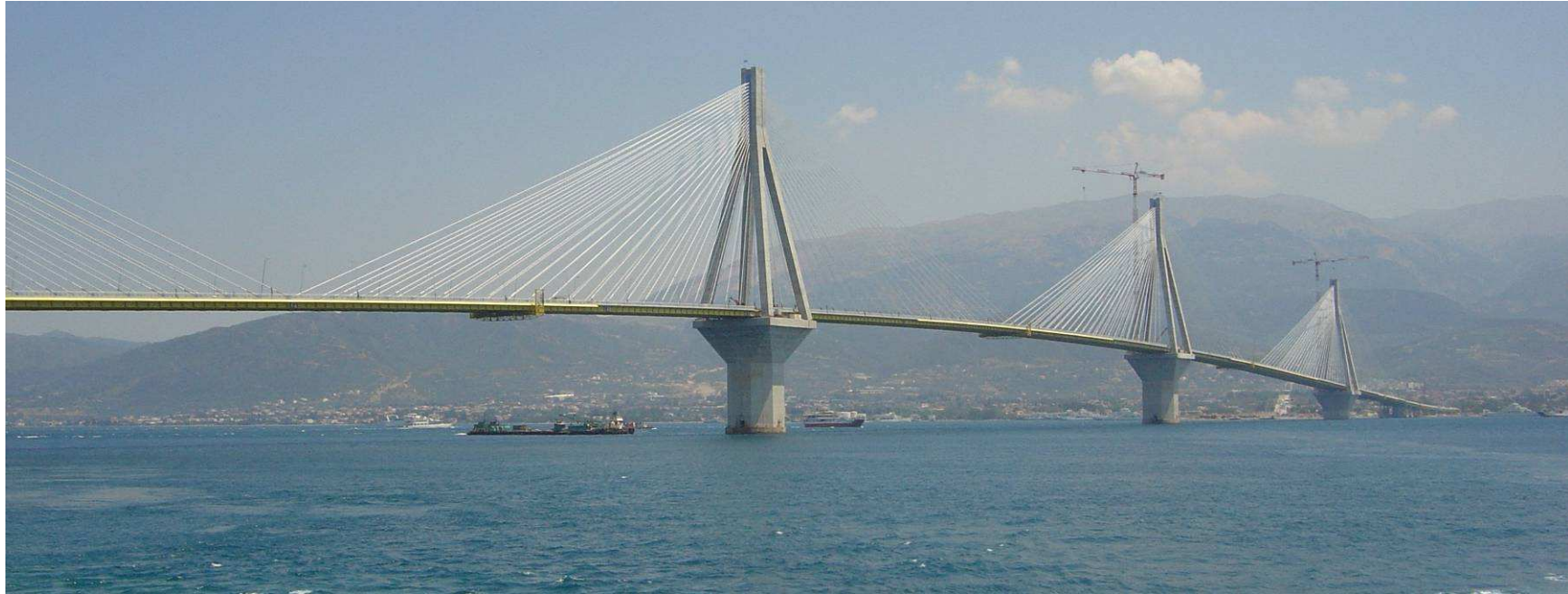
Pont de Rion-Antirion, mis en service en 2004, d'une longueur totale de 2880 m, avec des portées de 286 m et 560 m.

Un des grands projets en cours est le pont de Messine, pont suspendu, reliant la Sicile et l'Italie. Sa longueur totale sera de 5070 m avec une portée principale de 3300 m. Il a été calculé pour résister à des vents de 215 km/h et un séisme de 7.1 sur l'échelle de Richter. Sa construction a commencé en 2006 et sa mise en service est prévue en 2012.