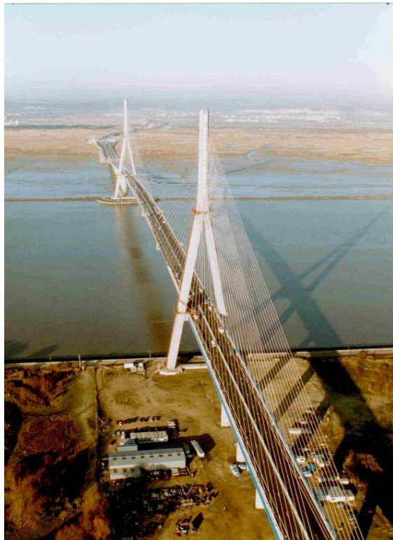
Pont de Normandie, pont à haubans d'une longueur totale de 2141 m, avec une portée centrale de 856 m (1989-1995)

Aujourd'hui, on cherche à allier les performances toujours croissantes du béton en compression, en l'utilisant pour les piles, et les avantages de l'acier, pour la réalisation du tablier. Cette association permet d'obtenir des ouvrages de plus en plus performants.